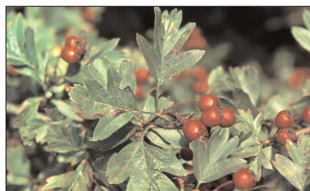
Aubépine ( Crataegus ) saine