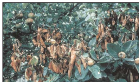
Attaque avancée de feu bactérien sur cognassier

La lutte contre le feu bactérien est réglementée dans l'ordonnance fédérale du 28 février 2001 sur la protection des végétaux [RS 916.20].