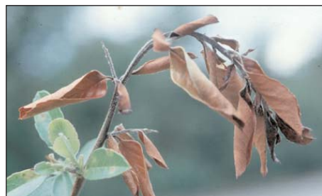
Rameau de buisson ardent ( Pyracantha ) atteint de feu bactérien