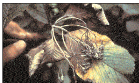
Alisier blanc ( Sorbus aria ) après infections