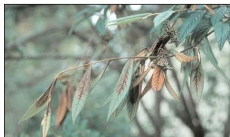
Attaque de feu bactérien sur Cotoneaster salicifolius avec symptômes typiques au mois de juillet