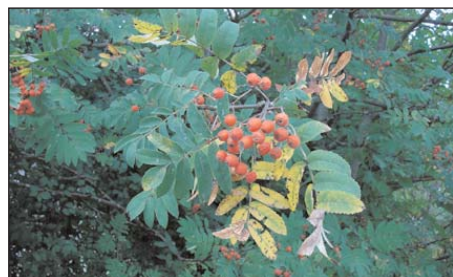
Sorbier sain ( Sorbus aucuparia ) en habit automnal

Centrale d'annonce «feu bactérien» dans votre commune: