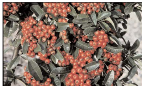
Buisson ardent ( Pyracantha ) sain

Illustrations: Erni Keller, Ermatingen; FAW; Strickhof Lindau