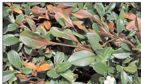
Symptômes de feu bactérien sur Cotoneaster dammeri 2 à 4 semaines après infection des fleurs (mois de juin)