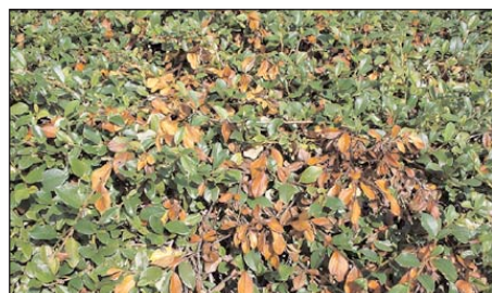
Attaque massive sur Cotoneaster dammeri (symptômes visibles à la fin juillet)