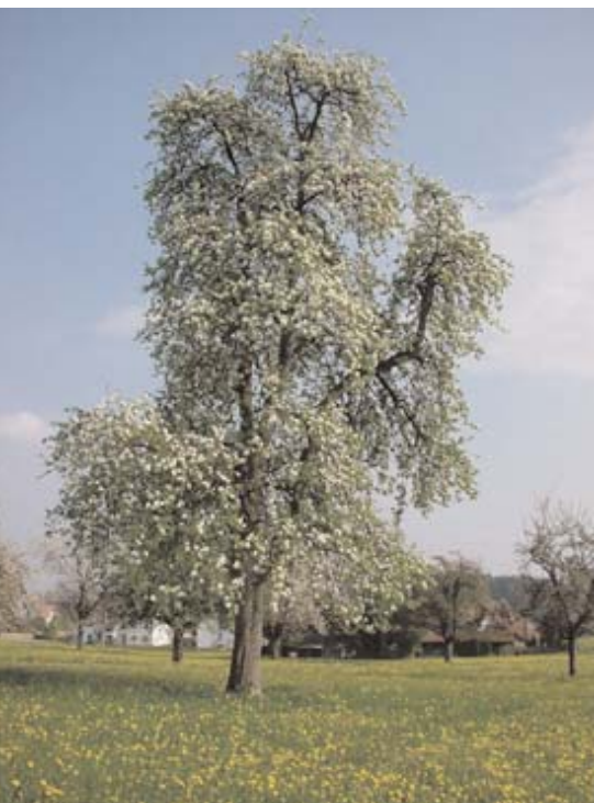
Le feu bactérien représente aussi une menace pour les arbres haute-tige de fruits à pépins et par conséquent le paysage.

Le feu bactérien est une maladie dangereuse des plantes, soumise à la déclaration obligatoire. Elle est causée par une bactérie et peut provoquer des dégâts économiques importants dans les cultures fruitières, les pépinières et les vergers haute-tige. Les arbustes sauvages et d'ornement contaminés jouent un rôle essentiel dans la propagation de la maladie. La production et la mise en circulation de végétaux du genre Cotoneaster et du genre Stranvaesia (= Photinia davidiana et Photinia nussia ) est interdite depuis le 1 er mai 2002. Certains cantons ont étendu l'interdiction à toutes les plantes-hôtes du feu bactérien (FR et TG).